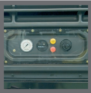
Tableau de bord complet

Porte verrouillable transparente comprenant manomètre de pression, compteur horaire, contact de préchauffage, contact de démarrage, voyants de préchauffage, de sécurité et de batterie. Boîte à fusibles accessible .